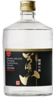
若松酒造(株) 『いろはのい (麦)』